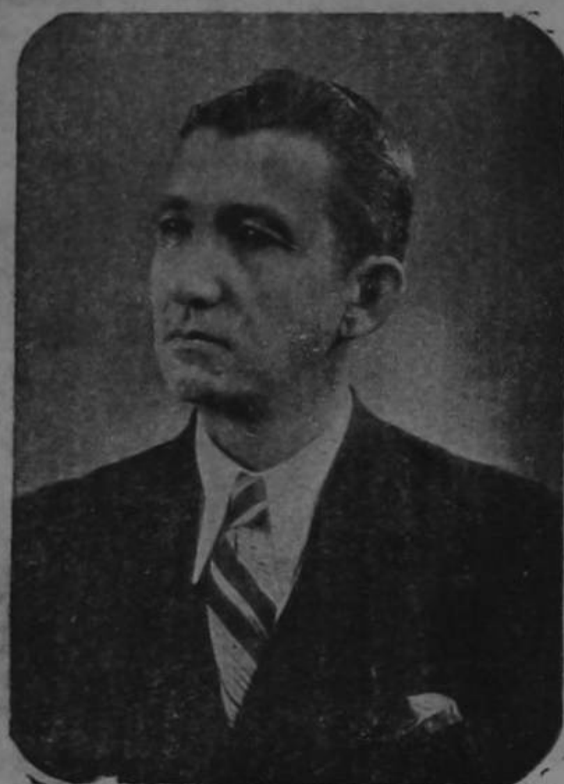
Licenciado don LEON CORTES CASTRO, Presidente de la República